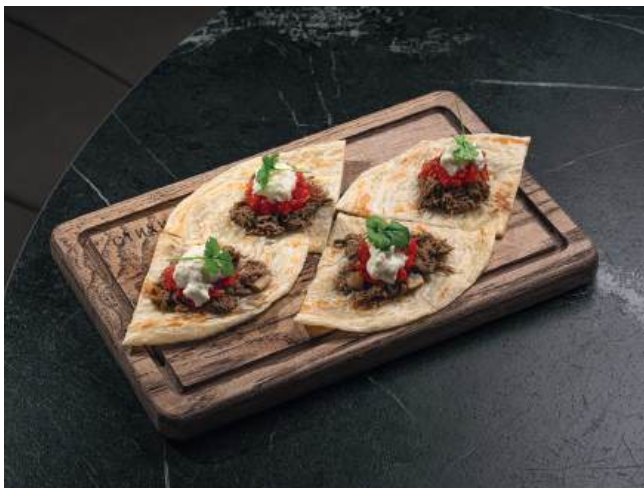
Роти с томленой говядиной