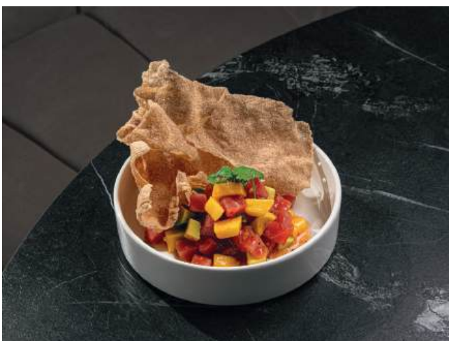
Тартар из тунца с манго и авокадо