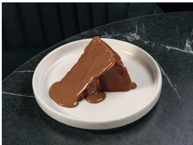
Чизкейк Сан Себастьян