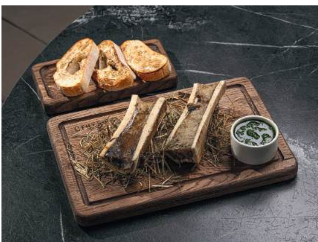
Мозговые косточки с соусом чимичурри