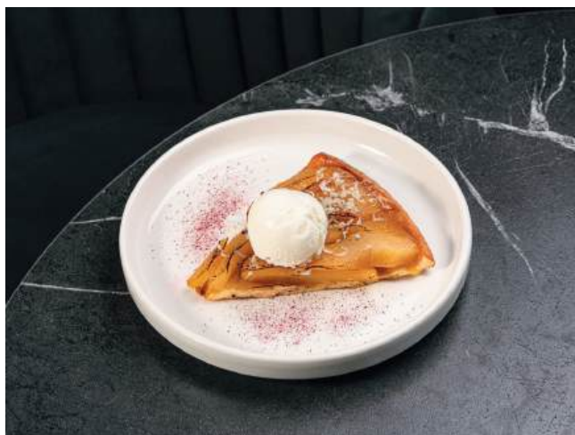
Тарт Татен с грушей