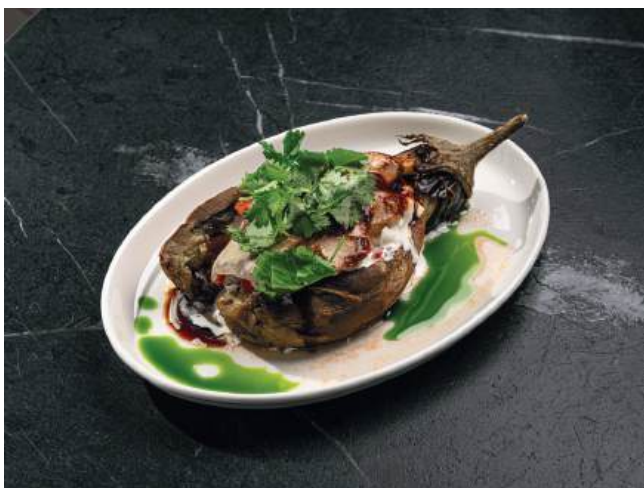
Печеный баклажан со страчателлой, томатной сальсой и покопченным угрем