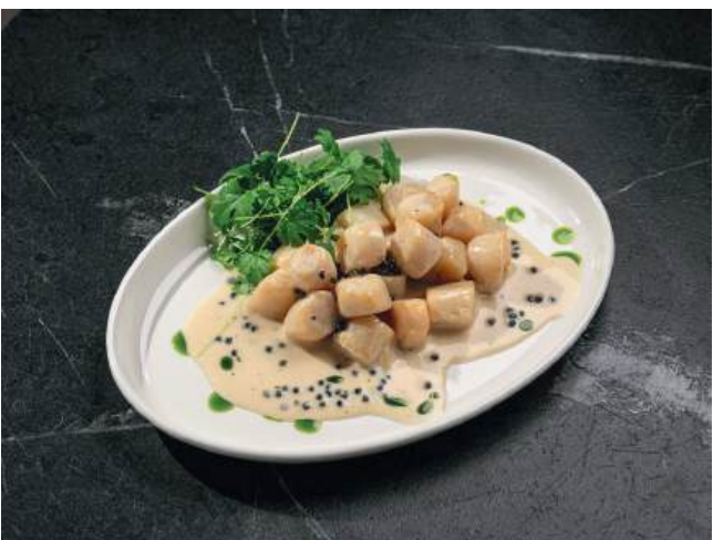
Морской гребешок с соусом берблан и черной икрой