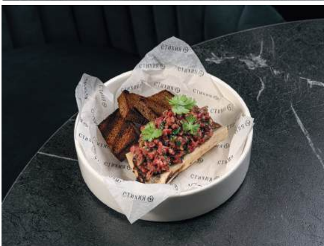
Тартар из пеканьи