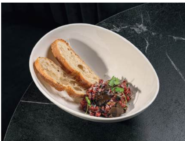
Тартар из говяжьей вырезки с черным трюфелем