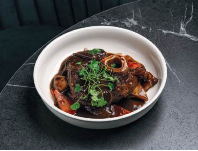
Особуко из говядины с овощами