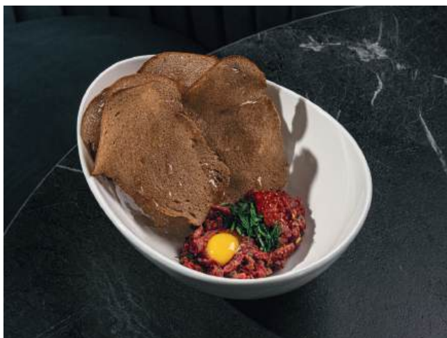
Тартар из говяжьей вырезки с красной икрой